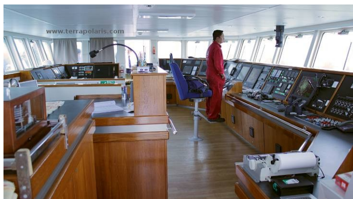
The spacious, modern bridge of the PLANCIUS is first of all a working place, but also almost always open to passengers. Die geräumige, moderne Brücke der PLANCIUS ist in erster Linie ein Arbeitsplatz, jedoch fast immer auch für Passagiere geöffnet.

The vessel offers a restaurant/lecture room on deck 3 and a spacious observation lounge (with bar) on deck 5 with large windows, offering full panorama view. M/v "Plancius" has large open deck spaces (with full walk-around possibilities on deck 3), giving excellent opportunities to enjoy the scenery and wildlife. She is furthermore equipped with 10 Mark V zodiacs, including 40 HP 4-stroke outboard engines and 2 gangways on the starboard side, guaranteeing a swift zodiac operation. M/v "Plancius" is comfortable and nicely decorated, but is not a luxury vessel. Our voyages in the Arctic and Antarctic regions are and will still be primarily defined by an exploratory educational travel programme, spending as much time ashore as possible. This vessel will fully meet our demands to achieve this.