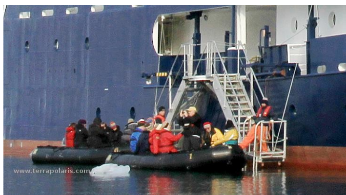
Remarkable: the short and double gangway on the starboard side of the PLANCIUS specifically for Zodiacs allows very fast Zodiac operations with two Zodiacs to be boarded or left simultaneously.

Bemerkenswert: die kurze und doppelte gangway auf der Steuerbordseite der PLANCIUS erlaubt sehr schnelle Zodiac Operationen, da zwei Boote gleichzeitig bestiegen oder verlassen werden können.