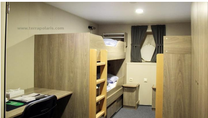
Deck 2: surely, conditions are narrower in the 4-berth-cabins, but there is still more than comparable cabins on some other expedition vessels.