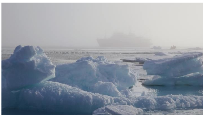
The PLANCIUS is built for exploration, including an ice-classed hull, which allows operations also in waters with drift ice. Here in misty conditions. Die PLANCIUS ist für Expeditionseinsatz gebaut, einschließlich eines Rumpfes mit Eisklasse für den Einsatz im Treibeis, hier unter nebligen Bedingungen.