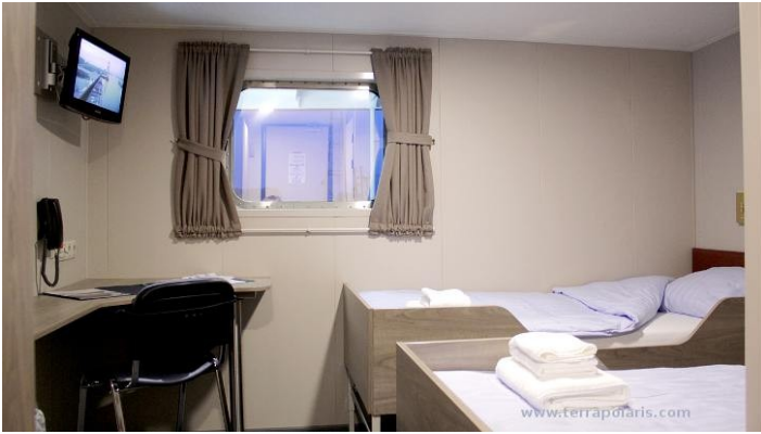
Deck 4: one of the twin cabins with window.