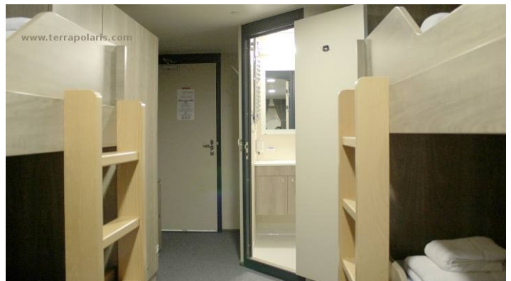
Deck 2: sicherlich sind die 4-Bett-Kabinen enger, bieten aber dennoch mehr Platz, als vergleichbare Kabinen auf etlichen anderen Expeditionsschiffen.

All cabins offer lower berths (either two single beds or one queen-size bed), except for the 4 quadruple cabins (for 4 persons in 2x upper and lower beds).