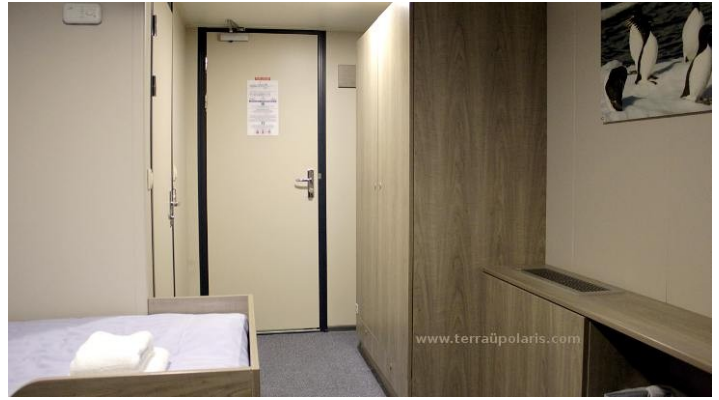
Deck 4: eine der Twin Doppelkabinen mit Fenster.