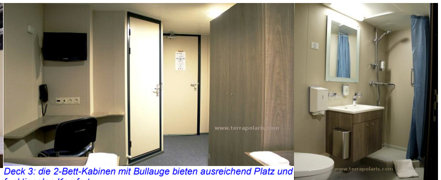
Deck 3: 2-berth passenger cabins with porthole offer good space and functional comfort