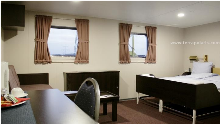
Deck 5: one of the spacious Superior twin cabin.