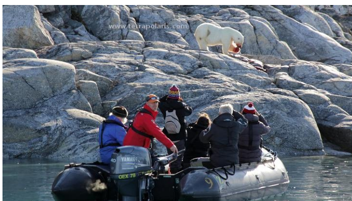
Thanks to 10-11 big Zodiac boats and a numerous staff team on board, all participants can be simultaneously out on the water – for landings to go on wilderness excursion on shore, or here on an observation cruise in Spitsbergen, watching a polar bear eating a seal. Dank 10-11 großen Zodiac Schlauchbooten und einem großen Betreuersteam an Bord können alle Passagiere gleichzeitig mit den Booten unterwegs sein – für Landungen zu Wildnisexkursionen an Land, oder hier bei der Eisbärenbeobachtung in Spitsbergen.

Bemerkenswert: die kurze und doppelte gangway auf der Steuerbordseite der PLANCIUS erlaubt sehr schnelle Zodiac Operationen, da zwei Boote gleichzeitig bestiegen oder verlassen werden können.