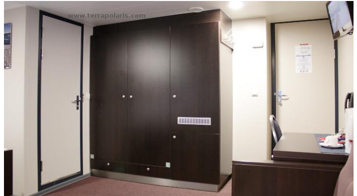
Deck 5: eine der geräumigen Superior Doppelkabinen.