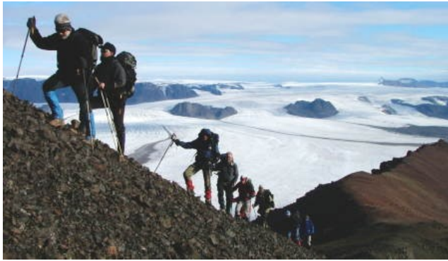
Tagestouren auf Aussichtsgipfel und das Erlebnis des stark vereisten ...