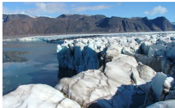
wie Gletscher – hier Blick in die Front des Mittag-Lefflerbreens

Die Tour führt durch eine Region abseits der gängigeren Wandergebiete Spitzbergens. Anders als in Nepal oder anderen Massen-Trekkingregionen sind hier pro Sommer kaum 100 Menschen unterwegs. Seit 1994 ist die Tour regulärer Bestandteil unseres Programms und erwies sich als sehr gut passend für den kleinen Kreis echter Trekking-enthusiasten.