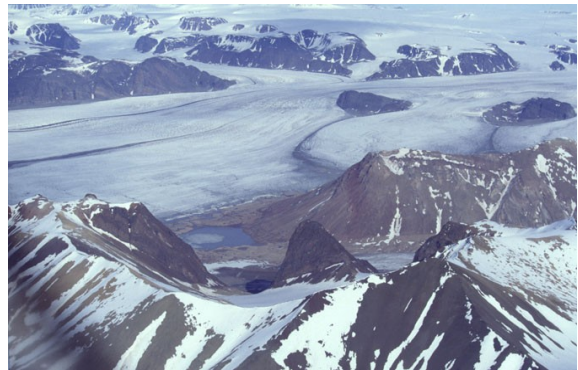
... und kaum besuchten Inlands (hier Luftbild)